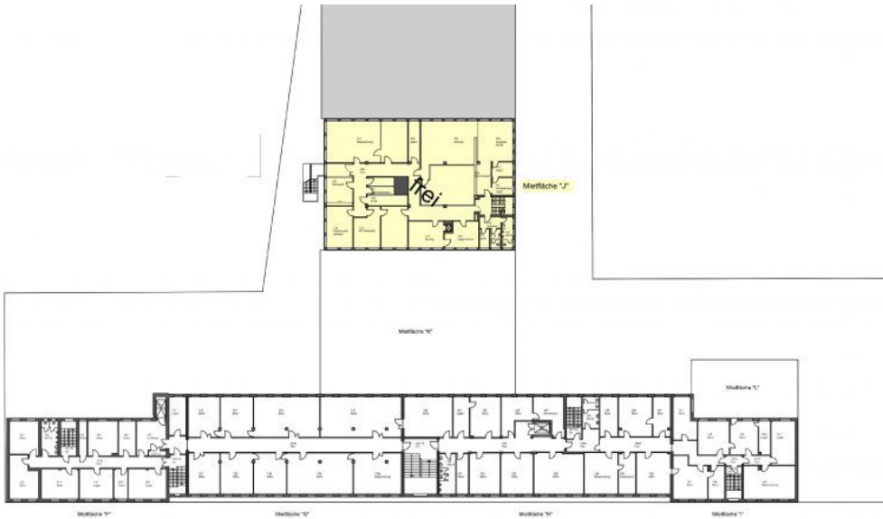
Grundrisskizze 1. OG