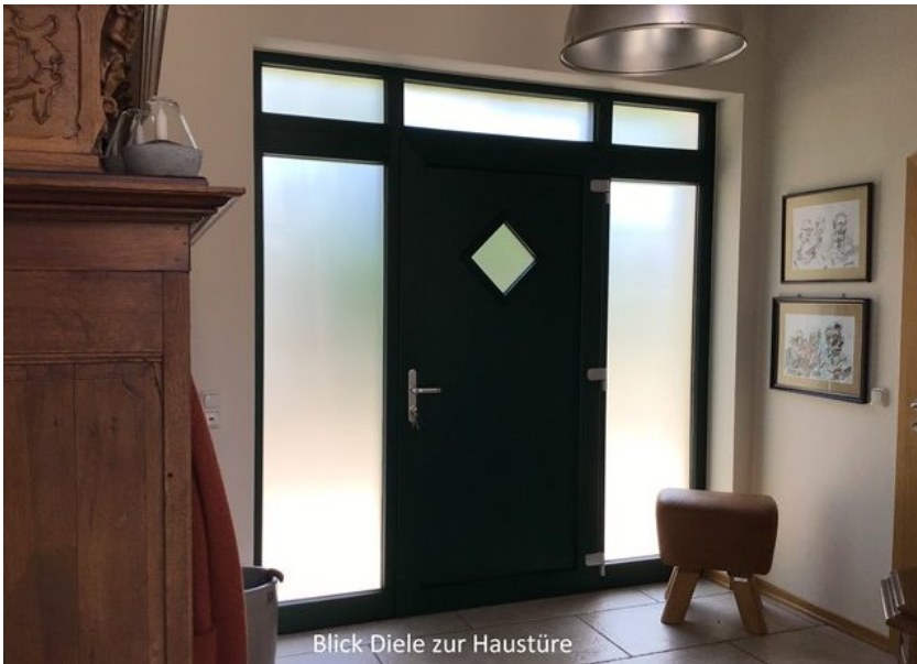
Blick Diele zur Haustüre