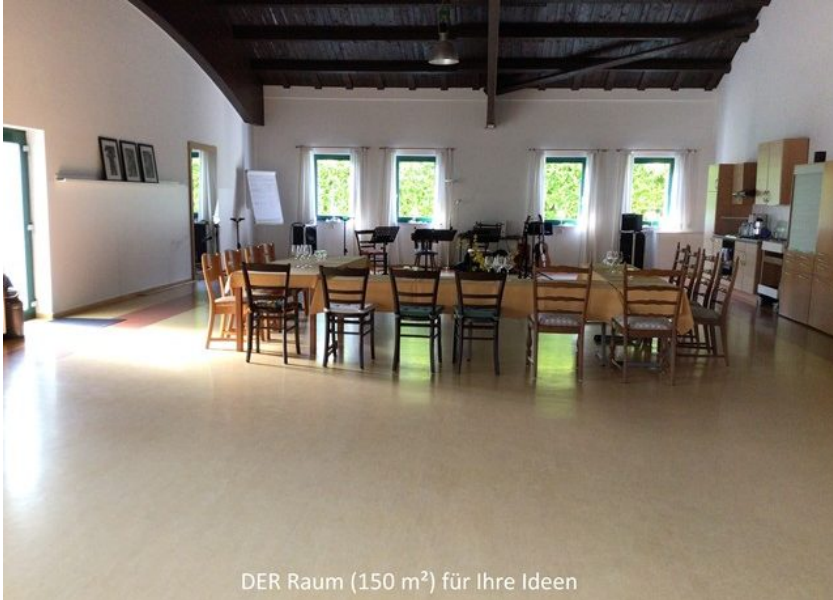
DER Raum (150 m 2 ) für Ihre Ideen