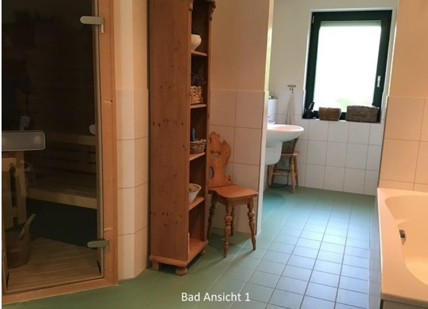
Bad Ansicht 1