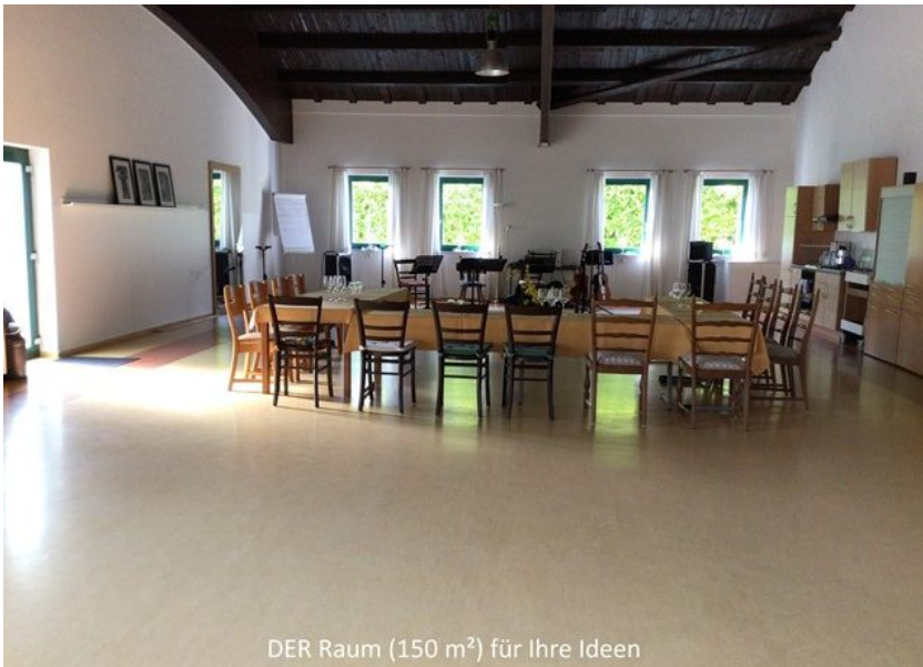
DER Raum (150 m 2 ) für Ihre Ideen