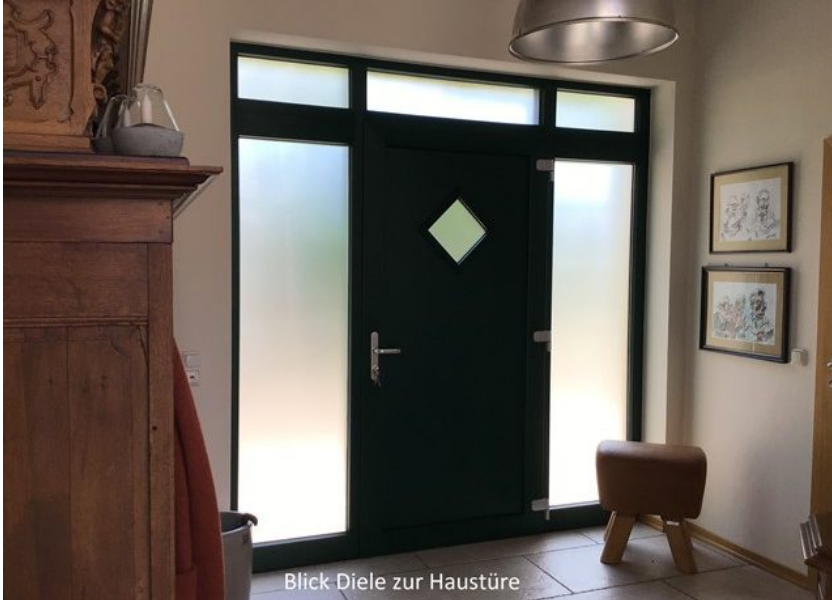
Blick Diele zur Haustüre