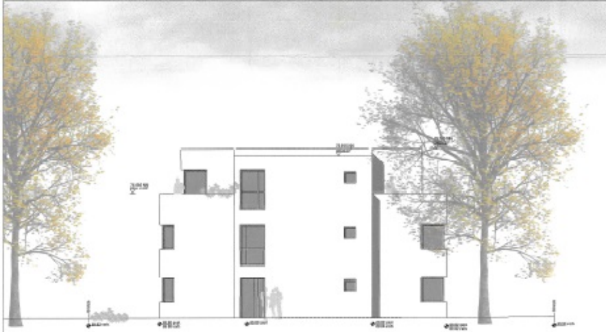
Nord, Gebäudeteil B