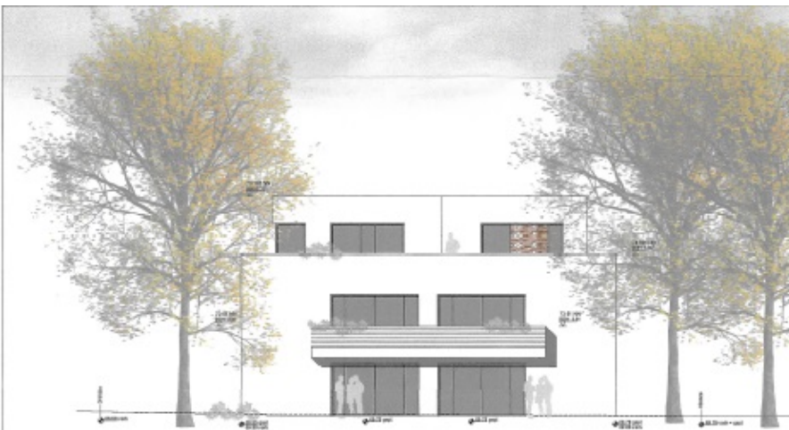
Süd, Gebäudeteil B