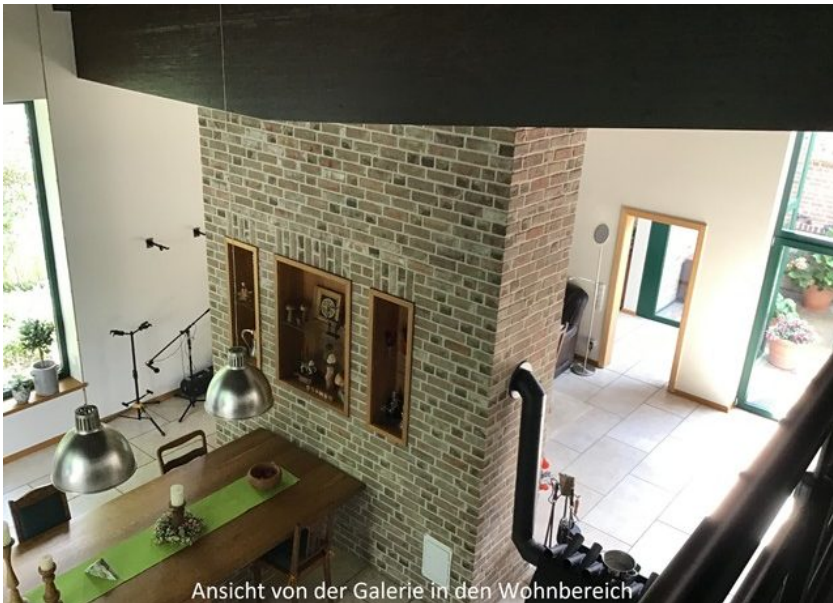
Ansicht von der Galerie in den Wohnbereich